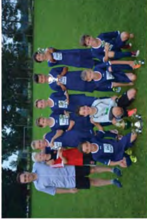
(Siegerfoto TSV Röttenbach Copyright Klaus Schiffflechner)

Der Post SV Nürnberg behielt mit 3:2 Toren knapp die Oberhand und feierte im Anschluss ausgelassen den Turniersieg.