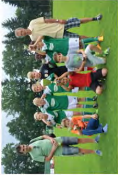
(Siegerfoto TSV Röttenbach)